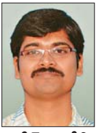
నతీష్ కంటేబి జేఎన్ మి

నష్టభయాన్ని పరిమితం చేసుకోవడానికి పెట్టుబడులలో వైవిధ్యం ఉండాలన్న విషయం మనం ఎప్పటినుంచో వింటున్నాం. అందుబాటులో ఉన్న అన్ని మదుపు సాధనాలకూ మన కష్టాల్లాన్ని కేటాయిస్తే.. ఎలాంటి ప్రతికూల పరిస్థితులనైనా తట్టుకోవచ్చనేది ఇప్పటికే నిరూపితమైన విషయం. షేర్ మార్కెట్లో పెట్టుబడులు పెట్టి, లాభాలు కక్షజూడాలనుకునే వారికి, ముఖ్యంగా మార్కెట్ వృద్ధి చెందుతున్న ప్రస్తుత పరిస్థితుల్లో ఇది ఎంతో కీలకమైనది. ఇలాంటప్పుడు మనం పెట్టే పెట్టుబడుల్లో పలు షేర్లకు, రంగాలకు ప్రాధాన్యం ఇవ్వాలి ఉంటుంది. అప్పుడే మార్కెట్లో ప్రతికూల పరిస్థితులు ఏర్పడినప్పుడు కూడా మన సొమ్ముకు పెద్దగా నష్టం వాటిల్లదు.